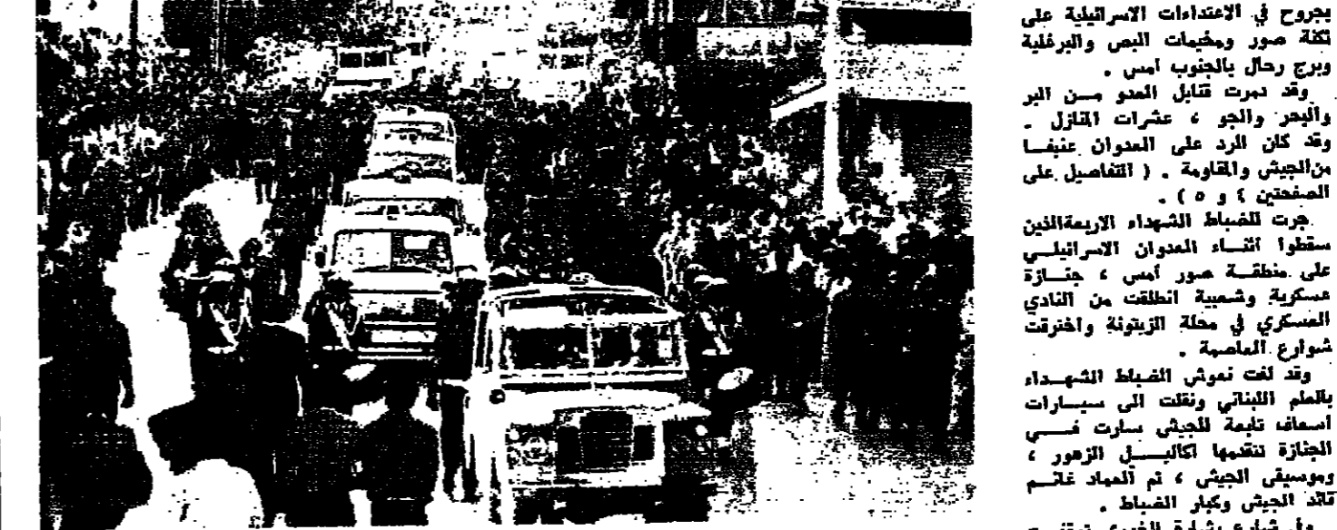
جانب من الحزبة العسكرية الشبيهة للضباط الشهداء في بيروت امس